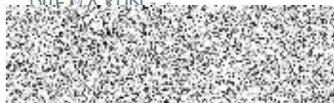
Dítě a kůň, z.s. – Sdružení pro hipoterapii